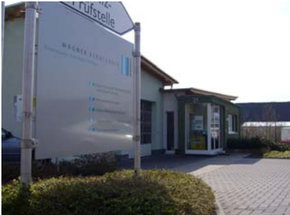
Büroansicht, Bad Camberg